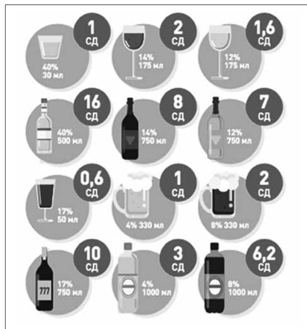
Рис. 1. Соответствие объема и крепости применяемых в быту алкогольных напитков количеству содержащихся в них стандартных доз алкоголя Fig. 1. Pure ethanol content in common alcoholic beverages according to their volume and alcohol by volume

Сбор алкогольного анамнеза (скрининг) должен быть стандартизован. Для этого существуют валидизированные опросники, «золотым стандартом» среди которых остается вопросник AUDIT (Alcohol Use Disorders Inventory Test), разработанный ВОЗ в 1982 г., который демонстрирует высокую чувствительность и специфичность в разных странах. Вопросник AUDIT включает 10 вопросов, которые можно условно разделить на секции: вопросы № 1–3 дают возможность получить от пациента информацию о количестве принимаемого алкоголя, вопросы № 4–6 направлены на выявление зависимости, вопросы № 7–10 позволяют получить информацию о проблемах, которые ассоциированы с приемом алкоголя (табл. 1). Каждый пункт оценивают путем выбора варианта ответа пациентом с последующим подсчетом баллов. В зависимости от количества набранных баллов производят интерпретацию теста.