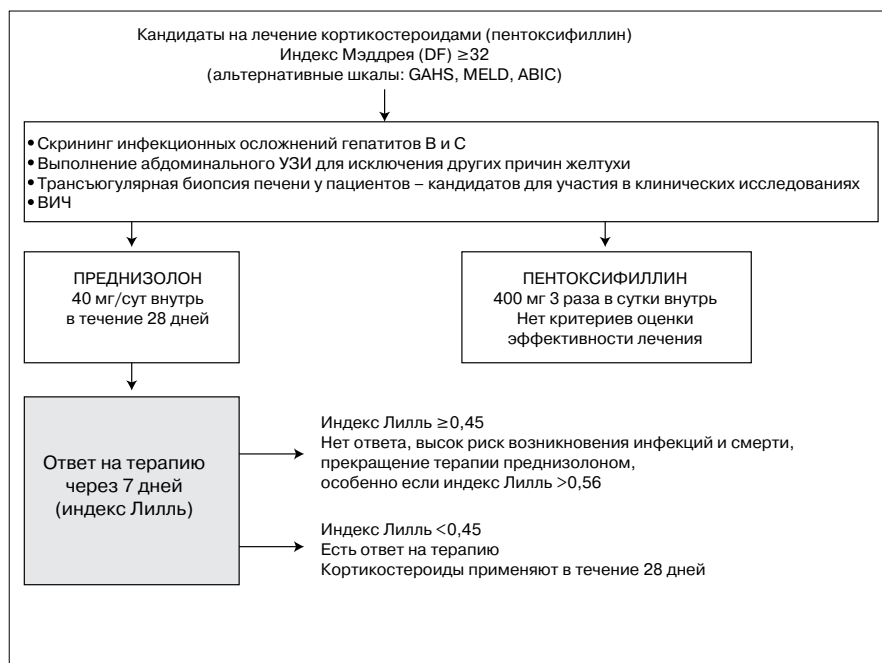
Рис. 4. Схема лечения пациентов с алкогольным гепатитом тяжелого течения [3]