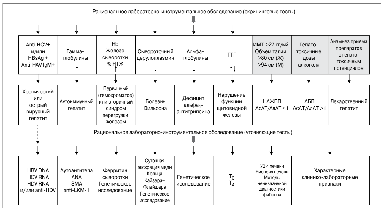
Рис. 3. Дифференциальный диагноз алкогольной болезни печени