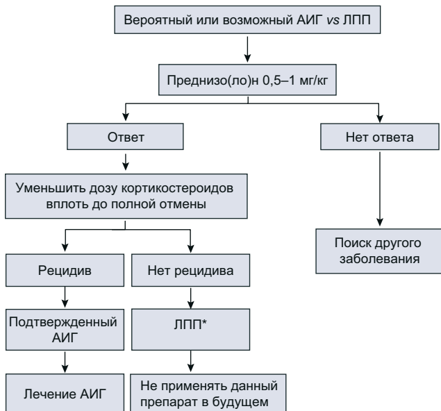
Рис. 1. Рекомендуемый алгоритм диагностики АИГ с определением четырех аутоантител методом РНИФ или твердофазного ИФА. Для подтверждения воспалительного гепатита, а также определения стадии поражения и активности всегда необходима биопсия печени.

* Для того чтобы не пропустить поздний рецидив АИГ, необходимо длительное наблюдение (например, обследование каждые 6 мес. в течение 3 лет).