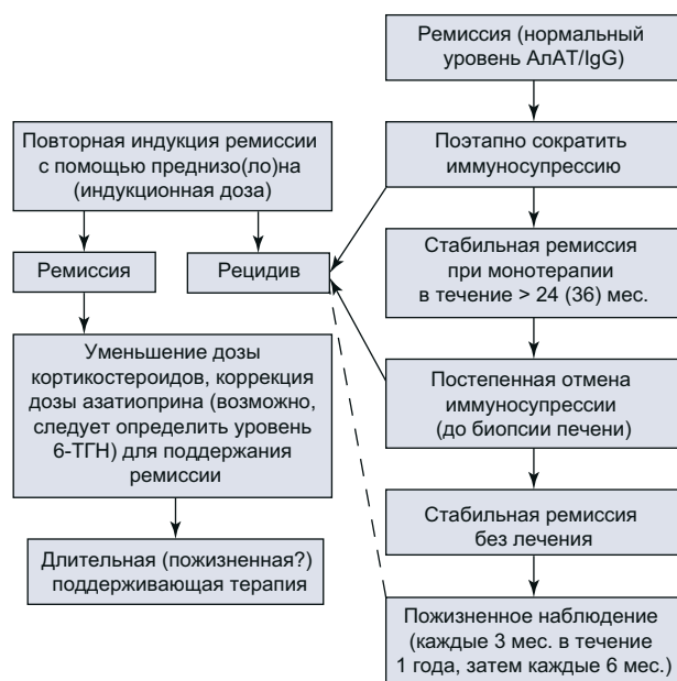
Рис. 5. Диспансерное наблюдение пациентов с АИГ, у которых установлена ремиссия. Обратите внимание, что после полной отмены препаратов ремиссия АИГ наблюдается нечасто и у большинства пациентов она не достигается.

Рецидив заболевания после отмены препаратов наблюдается часто (50–90 %) и обычно возникает в первые 12 мес. после прекращения лечения [201, 214–216]. Однако рецидивы возможны и в более поздний срок, что свидетельствует о необходимости пожизненного диспансерного наблюдения даже без применения иммуносупрессивной терапии. Рецидивом в соответствии с критериями IАИГ считается повторное повышение активности АлАТ > 3 \times ВГН, хотя у пациентов может наблюдаться и менее выраженное повышение активности АлАТ и/или уровня IgG. Для подтверждения рецидива биопсия печени необязательна, поскольку повышение активности АлАТ имеет высокое прогностическое значение. Согласно данным литературы, более высокая частота рецидивов может быть связана со следующими факторами: 1) слабый ответ на иммуносупрессию; 2) персистирующее повышение активности сывороточных аминотрансфераз и/или уровня глобулинов и IgG; 3) остаточное воспаление в печени по данным биопсии; 4) уменьшение продолжительности лечения [191, 209, 211, 218, 219]. У пациентов с известным пусковым фактором на момент первого проявления заболевания рецидивы встречаются реже [74].