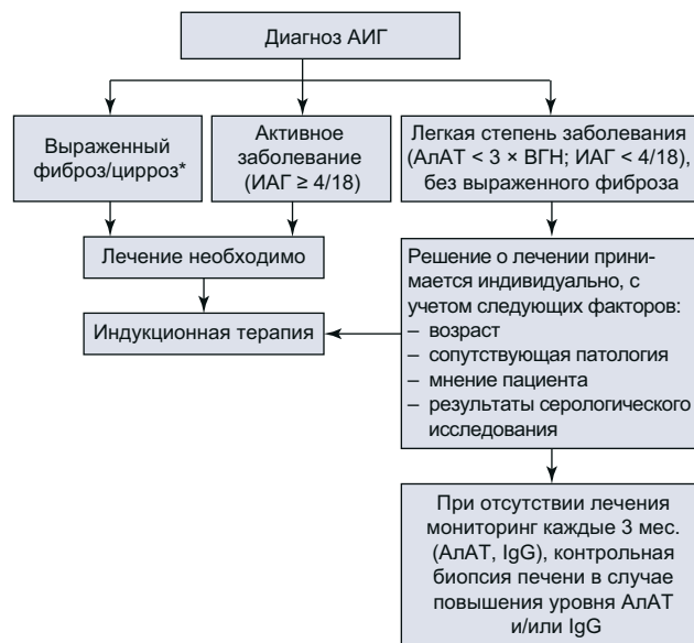
Рис. 3. Алгоритм лечения с индивидуализированным решением по поводу применения терапии кортикостероидами, исходя из результатов обследования. Например, лечение необходимо пациенту с активным заболеванием (повышение активности аминотрансфераз > 3 \times ВГН и ИАГ > 4/18 ).

Польза иммуносупрессивной терапии в плане улучшения исходов у пациентов пожилого возраста без клинических проявлений, со слабой некрвоспалительной активностью по данным биопсии печени не доказана, поэтому тактика лечения в этих случаях четко не регламентирована (рис. 3). Связанные с лечением побочные эффекты должны уравниваться риском субклинического прогрессирования заболевания и переходом в клинически выраженную болезнь, а также ожидаемым полным или устойчивым ответом на лечение. 10-летняя выживаемость нелеченых пациентов с легким течением заболевания составляет 67–90 % [180, 181]. В одном из неконтролируемых исследований у нелеченых пациентов без клинических проявлений продолжительность жизни была такой же, как и у больных, получавших иммуносу-