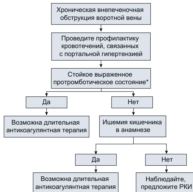
Рис. 3. Предполагаемый алгоритм принятия решения о постоянной антикоагулянтной терапии у пациентов с хронической обструкцией воротной вены. * Оценка основана на собственном и семейном анамнезе спонтанного тромбоза глубоких вен и на данных за изолированные или комбинированные протромботические нарушения. РКИ — рандомизированное контролируемое исследование.

У взрослых пациентов часто имеют место сопутствующие протромботические нарушения и местные факторы. Эти нарушения во многом определяют исход и могут потребовать специфической терапии (рис. 3).